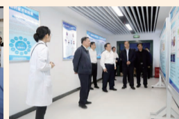
参观国家地方联合工程实验室