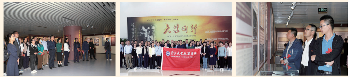
认真聆听讲解 集体合影 仔细观看事迹介绍和手稿

4月18日下午，我校党委宣传部组织各党总支支部书记、支部书记、宣传(统战)委员、民主党派人员和学生110余人，赴河南省政协文史馆参观《大道同行——从“五一口号”到协商建国重要史事回顾》主题展览。本次参观由党委宣传部部长