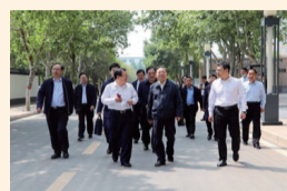
全国政协常委尚勇莅临我校调研指导工作