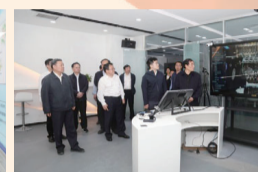
参观虚拟现实工程技术中心