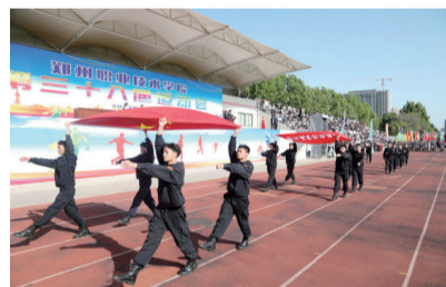
国旗、校旗护旗队入场