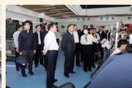
参观工业机器人应用工程研究中心