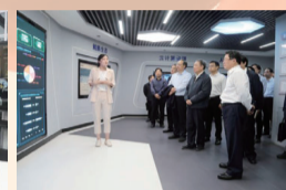
参观华为 ITC 产教融合基地