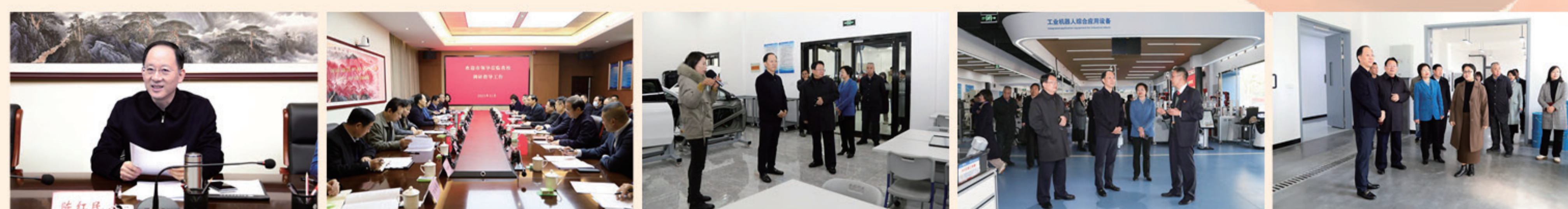
陈红民副市长讲话 座谈会在我校信息图文中心 404 会议室举行 实地考察我校汽车综合实训中心 实地考察我校工业机器人工程技术中心 实地考察我校超硬材料及制品工程技术中心

11月14日上午，郑州市副市长陈红民一行莅临我校调研产教融合工作。市教育局、市发改委、工信局、财政局、人社局分管负责同志、八处相关人员、相关企业负责人陪同调研。我校党委书记苗晋琦等领导与我司相关部门负责人参与调研。 调研座谈会在我校信息图文中心 404 会议室进行。郑州市教育局副局长葛飞汇报了郑州市产教融合开展情况、面临困难和下一步工作。我校党委书记苗晋琦汇报了我校以产建设在产业链上、精准服务地方经济社会的办学治校理念和专业建设成就、校企合作与产教融合的大力推进情况、应用研究开发平台建设情况以及学校人才培养和党建工作。