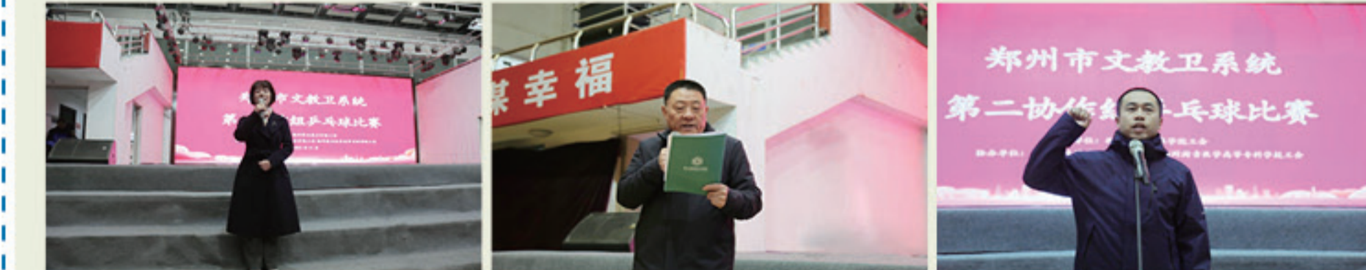
郑州市文教卫工会系统第二协作组职工乒乓球比赛

11月25日，郑州市文教卫工会系统第二协作组职工乒乓球比赛在我校体育馆顺利举行。参加本次比赛的有郑州职业技术学院、郑州旅游职业学院、郑州卫生健康职业学院、市委党校、郑州财税金融职业学院等12家成员单位。赛场上，运动员们一个个精神饱满、神情专注、稳扎稳打、奋力拼搏，随着乒乓球在台上来回飞舞，比赛选手不断的变换步法和战术，侧身步、并步、碎滑步、跨步、滑步等，身形轻盈而灵活；发球抢攻、下旋球、吊边角、提拉、推挡等，或