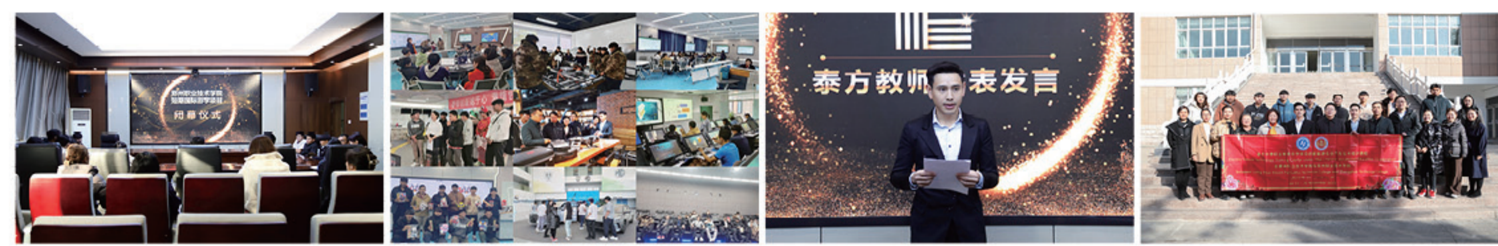
闭幕仪式 课程学习体验 泰方教师代表发言 合影留念

在热情、友好的氛围中，我校短期国际教育游学项目于11月25日下午圆满闭幕。泰国龙婆坤职业技术学院的10名师生代表以及我校的相关教师代表共同出席了闭幕仪式。此次游学项目是我校首次